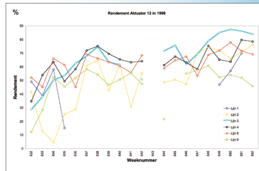
Rendement Aktuator 12 in 1998.

Dit programma richt zich op het logistieke concept, waarbij het realiseren van flow wordt nagestreefd. Het doel van lean is waarde toe te voegen door flow te realiseren. Deze flow kan voor een deel worden gerealiseerd door 'de 7 verspillingen' te elimineren. Dit is echter niet een doel op zich, zoals vaak wordt gedacht. Eén van de verspillingen is voorraad. Maar ook in het lean concept mogen, in tegenstelling tot wat vaak wordt gedacht, wel degelijk (tussen) voorraden worden aangehouden, daar zijn immers de Kanban-methode en het supermarktconcept op gebaseerd. Het belangrijkste hulpmiddel uit de Lean-methode is de Value Stream Mapping, een manier om het proces over de afdelingen heen in kaart te brengen en op basis daarvan aan de doorlooptijdverkorting te werken. Veel tools worden aangereikt, echter over de inpassing in het dagelijkse werk en het veranderaspect blijven in de lean-methode onderbelicht. Dit is overigens niet erg, want voor deze aspecten kan prima uit de TPM methode en Six Sigma worden geput. De methode wordt het meest toegepast in make to order omgevingen (bijvoorbeeld persoonlijk gemaakte presentjes www.personalgifts.nl of op www.nike.com