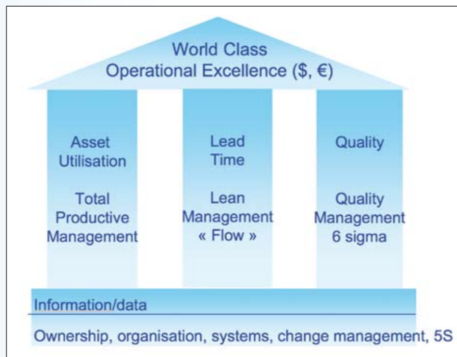
Plaatje 1: World Class Operational Excellence.

Als we de operationele bedrijfsvoering nader bekijken, blijkt vaak dat naast het beoogde primaire proces nog een aantal zaken plaatsvinden. Deze extra activiteiten worden soms ook de 'hidden factory' genoemd, zoals zoeken, lopen, wachten en rework. Deze 'hidden factory' brengt altijd extra kosten met zich mee. Om gestructureerd de bedrijfsprocessen te verbeteren zijn thans drie verbeterprogramma's gangbaar, elke met een eigen focus. Vanuit het Toyota Productie Systeem (TPS) zijn Total Productive Maintenance (TPM) en Lean Management bekend, daarnaast is 6 sigma (van Motorola en bekend geworden door Jack Welch van General Electric) een bekend programma.